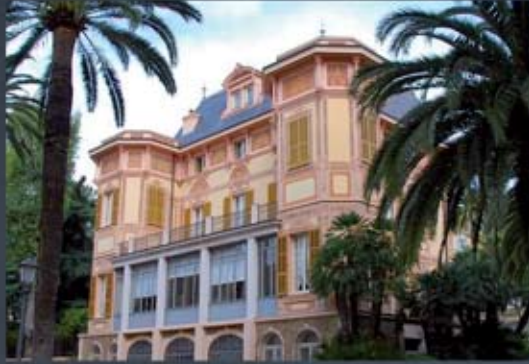
Villa Nobel, San Remo

600 yıllık Osmanlı Devleti'nin son padişahı Sultan Vahdettin, ülkenin çöküş döneminde, Anadolu'da gelişen Kuvayımilliye Hareketi'ni, kendine karşı bir tehdit olarak algıladı. Saray düzenini ve tahtını kaybetmemek için işgalcilere hizmet eden bir hükümdar olmayı seçti. Anadolu Hareketi, millî ayaklanmayı gerçekleştirip vatani işgalcilerden temizleyince de ülkeden kaçmak zorunda kaldı. İslam halifesi olarak eski Osmanlı topraklarında kurulan yeni devletlerce de kabul görmedi. Sonunda İtalya'ya sığındı.