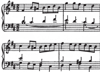
Anglaise (Bach'ın No. 3 Fransız Suiti'nden)

Anglaise (Fr.). Anglez. 1) İngilizlerin country-dance adını verdikleri 2/4, 3/4 ve 3/8'lik ölçülerde yazılan, çoşukulu, canlı bir halk dansı. 2) İngiliz tarzı, üslubu.