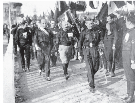
Mussolini Roma'ya giriyor

Ekim 1922 günü Mussolini iktidara gelirken kara gömlekliler de askeri disiplin içinde Roma'ya girdi. O sıralar sonraki yüz yıl boyunca faşizmin bambaşka bir anlam kazanacağını tahmin eden kimse yoktu.