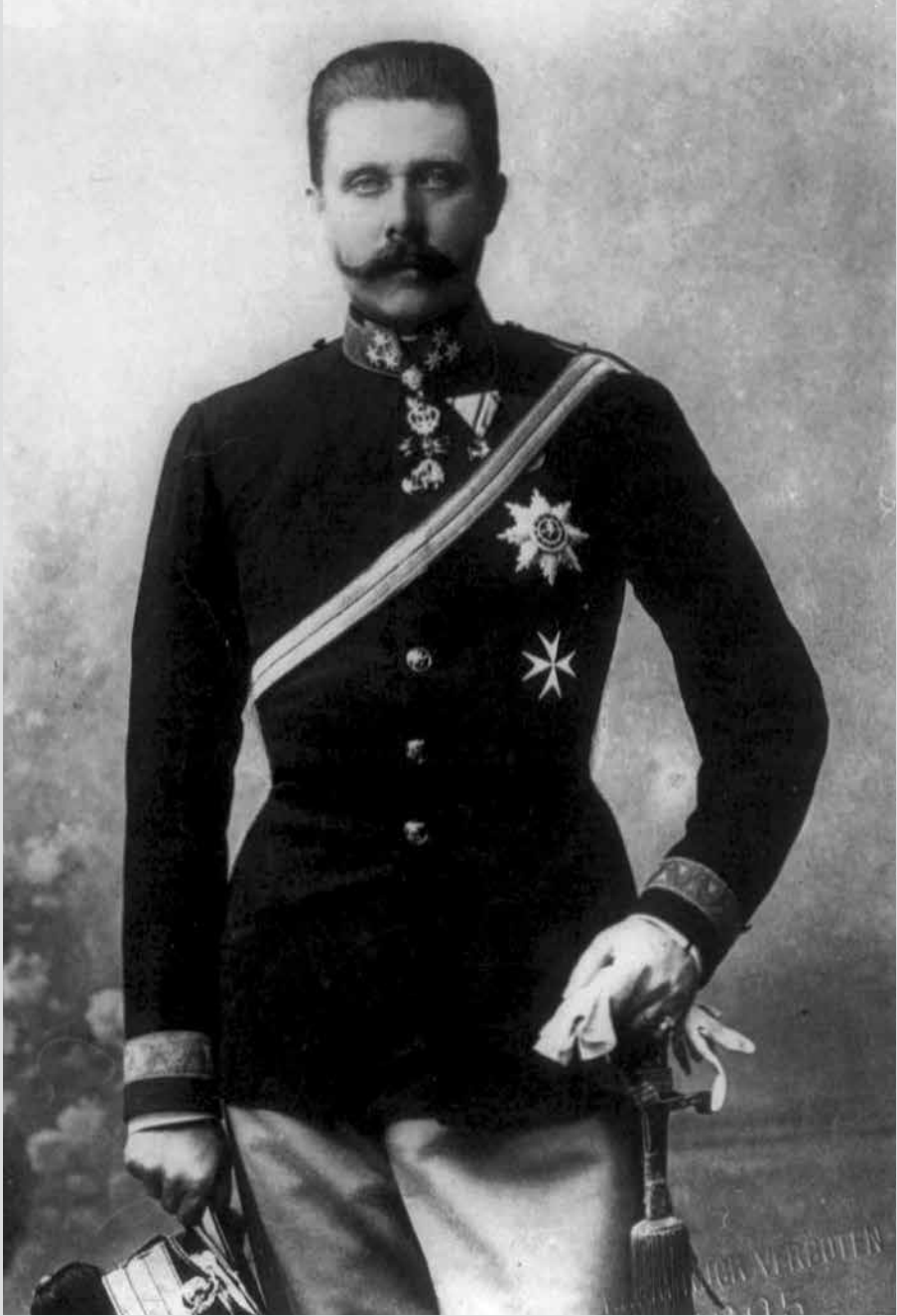
Arşidük Franz Ferdinand