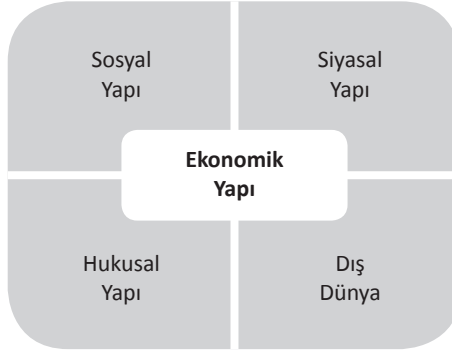
Şema 1: Ekonomik Yapıyı Etkileyen Çerçeve

Şemadan görüldüğü gibi ekonomik yapı, sosyal, siyasal ve hukuksal yapıdan ve dış dünyadan etkilenecek şekilde oluşur. Dolayısıyla bu alanlarda istikrar sağlanamazsa ekonomik yapıda da kalıcı istikrar sağlanamaz. Dış dünyada olup bitenle ilgili olarak yapılabilecekler sınırlı olduğundan ekonomik yapının sağlam tutulabilmesi için asıl olarak ülke içindeki sosyal, siyasal ve hukuksal yapıyı düzgün biçimde oluşturmaya çalışmak gerekir.