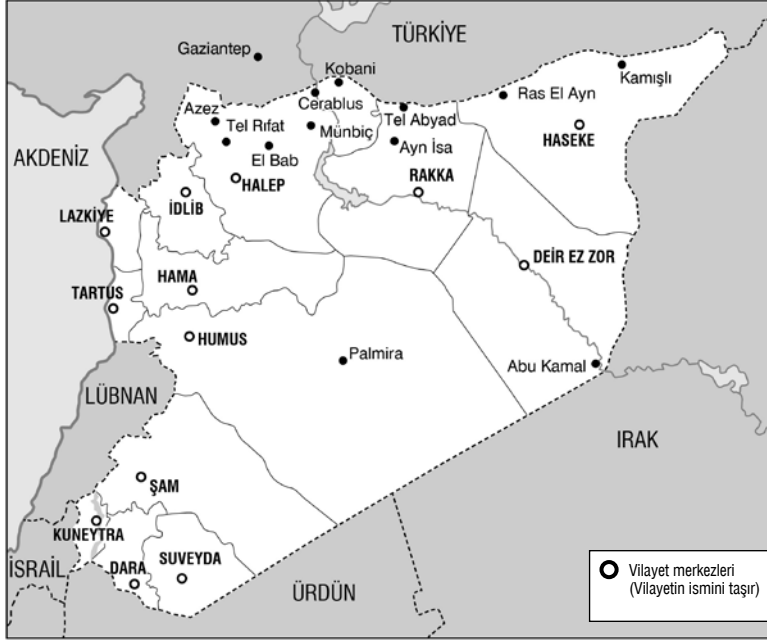
Suriye ve Vilayetleri