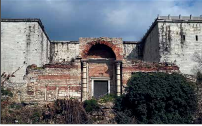
Altın Kapı ve Küçük Altın Kapı.

silsilesinden bugüne baki kalan parçalar var içinde. Sur dışı, gravürlerde ve önceki asırdan fotoğraflarda adeta taştan bir orduyla kuşatılmış gibi görünür. Uzun yoldan gelmiş savaş yorgunu neferlerin İstanbul'a varmanın rehavetiyle servilerin gölgesine serilip, omuz omuza payitahtı hayranlıkla izlerken, bir daha hiç uyanmayacakları sonsuz uykuya dalıp kaldıkları zannedilebilir. Yahya Kemal Beyatlı'nın "Aziz İstanbul" şiirinin son iki dizesi onları anlatır sanki: