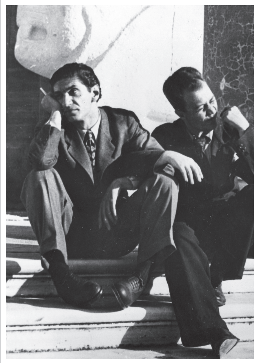
▲ Abidin Dino ile Fikret Muallâ 1937'de İstanbul'da bohem bir yaşantı içinde, Arkeoloji Müzesi'nin merdivenlerinde.