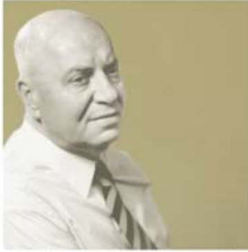
Şevket Süreyya Aydemir (1897-1976)

Enver Paşa, yenileşme çağının getirdiği uluslaşma sürecinde sivrilen bir komutandır. “Hürriyet kahramanı” olarak tarihe geçerken I. Dünya Savaşı sırasında yaşanan Sarıkamış dramı ve Orta Asya serüveniyle de anılmaktadır.