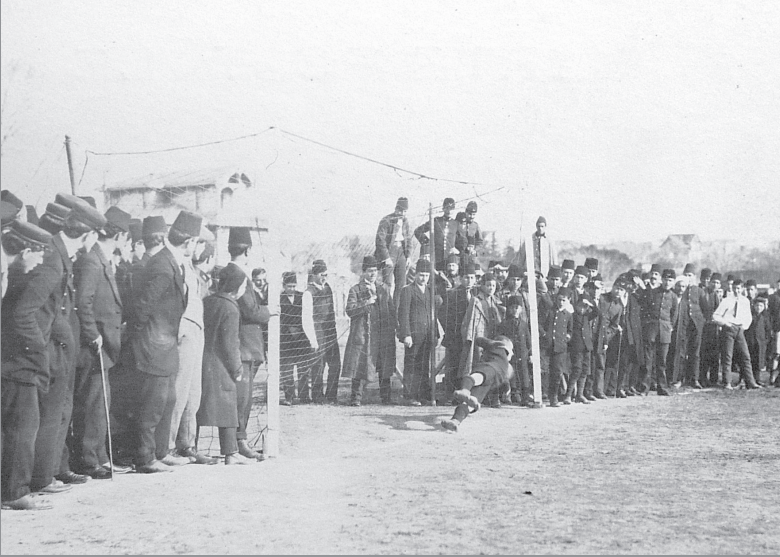
İngilizlerin “mahallesi” Moda’ya yakın çayırlar, şehirde futbolun oynanmaya başladığı ilk “stadlar” olmuştur.