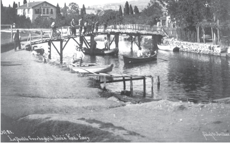
Kurbağalıdere, Ahşap Köprü (1905). Sandallar gezintiler için hazır. Şimdi taş üzerinden arabalar geçiyor.

Yaptırılan kale direkleri –Türkler daha sonra bunları “golpost” olarak adlandırdılar– portatifti. Maç oynanacağı zaman futbolcular tarafından sahaya taşınıyordu. İlk ligin oynandığı 1904 yılına kadar olan ilk 4 yılda bu portatif kale direkleri kullanıldı. Ardından Lig (Şilt) düzenlemeye karar verdiklerinde, tıpkı yaptıkları abanoz ağacından şık Şilt gibi, kale direklerini de Londra’dan getirttiler. (4)